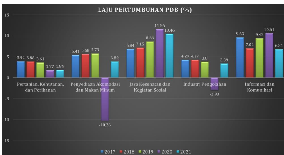
Gambar 2. Grafik Laju Pertumbuhan PDB

Pandemi covid-19 di tahun 2020 memberikan dampak penurunan laju pertumbuhan PDB di berbagai sektor. Penurunan laju pertumbuhan yang terjadi di sektor pertanian, kehutanan, dan perikanan di tahun 2019 yang semula menunjukkan 3,61% mengalami penurunan menjadi 1,77 %. Penurunan laju pertumbuhan paling parah terjadi pada sektor penyedia akomodasi dan makan minum yang semula di tahun 2019 menunjukkan 5,79% mengalami penurunan menjadi -10,26%. Begitu pula penurunan pada sektor industri pengolahan yang semula di tahun 2019 menunjukkan 3,8% mengalami penurunan menjadi -2,93%. Selain penurunan, pandemi covid-19 juga memberikan peningkatan di sektor jasa kesehatan dan kegiatan sosial yang semula di tahun 2019 menunjukkan 8,66% mengalami peningkatan di tahun 2020 menjadi 11,58 %. Selain itu di sektor informasi dan komunikasi yang semula di tahun 2019 menunjukkan 9,42% mengalami peningkatan di tahun 2020 menjadi 10,61 %. Di tahun 2021, semua sektor berusaha mengembalikan stabilitas setelah mengalami penurunan presentase akibat pandemi covid-19. Kondisi inilah yang disebut dengan “bounce back” dimana laju pertumbuhan kembali memantul lebih tinggi agar laju pertumbuhan PDB di Indonesia meningkat dan memberikan presentase yang lebih baik.