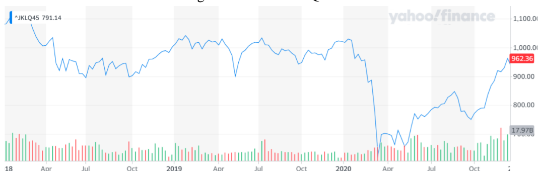
Gambar 1. Volatilitas harga saham Indeks LQ 45 Periode 2018-2020