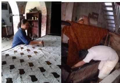
Gambar 1.2 Proses pewarnaan dengan colet dan celup (Sumber Primer)

Pekerjaan memberikan warna pada kain batik ini dapat berupa mencelup, dapat secara coletan atau lukisan ( painting ). Proses mencelupan warna membutuhkan 2 pekerja sekaligus untuk mencelupkan warna secara bergantian.