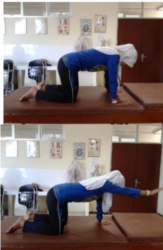
Gambar 3.14 Arm stabilization exercise

angkat salah satu tangan hingga lurus. Ambil nafas saat mengangkat tangan dan buang nafas pada saat tangan diturunkan. Lakukan secara bergantian tangan satu dengan lainnya. Pertahankan 5-10 detik saat mengangkat (pengulangan 10 kali).