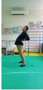
Gambar 3.9 Stretching pinggang