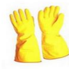
Gambar 3.22 SarungTangan Latex

batik yang berbahan vynil yang kedap dengan air (Tarwaka et al., 2016). Penggunaan sarung tangan disesuaikan dengan bagian pekerjaanya. Jika tangan yang berkontak langsung dengan cairan seperti pewaran dan ngelorot maka menggunakan sarung tangan Panjang sampai bawah siku. Sedangkan pada pembatik baik cap atau yang lain menggunakan sarung tangan sampai melindungi pergelangan tangan.