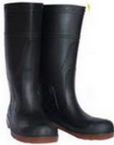
Gambar 3.26 Sepatu Boot

digunakan adalah sepatu boot berbahan karet. Pekerja menggunakan kaos kaki terlebih dahulu sebelum memakai alat pelindung kaki berjenis sepatu boot berbahan karet.