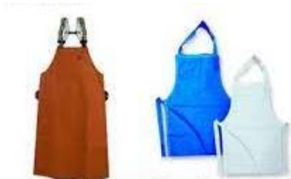
Gambar 3.25 Apron Kedap Air

yang longgar dan mudah dalam bergerak sehingga penguapan keringan lebih cepat. Di lingkungan industri batik Pekalongan yang APD pelindung tubuh yang diperlukan yaitu apron yang berbahan kedap air dan lilin. Hal ini dimaksudkan untuk mencegah cairan atau lilin menempel pada baju dan mudah dibersihkan.