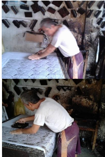
Gambar 2.3 Proses Pengecapan (Sumber Primer)