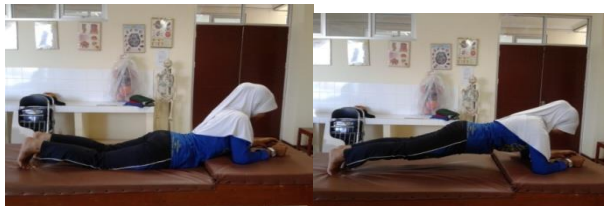
Gambar 2.21 Prone Brige exercise

Latihan dapat dilakukan pada posisi awal tidur tengkurap, perlahan angkat badan lurus dengan tumpuan kaki dan siku ( elbow fleksi ). Pertahankan keseimbangan tubuh lurus dari kepala sampai tumit. Tahan selama 5 - 10 detik dan kemudian kembali ke posisi awal. Lakukan latihan dengan perlahan-lahan, hindari gerakan menyentak secara tiba-tiba (pengulangan 10 kali).