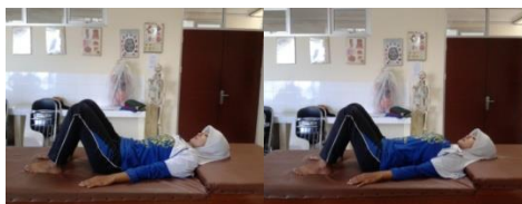
Gambar 3.12 Latihan Pelvic Tilt Lying