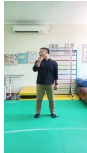
Gambar 3.3 Stetching leher