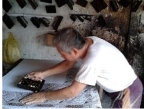
Gambar 1.1 Proses Mencap

sebagai peletak kain mori, wadah lilin panas dan canting cap. Canting cap memiliki berat antara 0,25 kg – 1 kg.