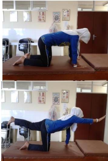
Gambar 3.16 arm and legh stretch and Stabilizzation exercise

Pertahankan 5-10 detik saat mengangkat (pengulangan 5 - 12 kali).