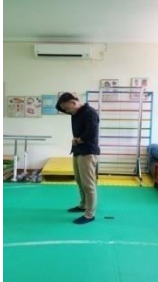
Gambar 3.1 Stretching leher