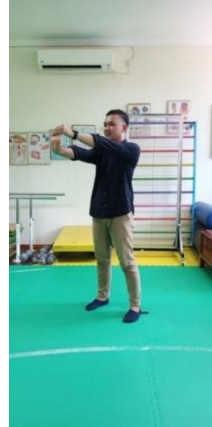
Gambar 3.4 Stretching telapak tangan