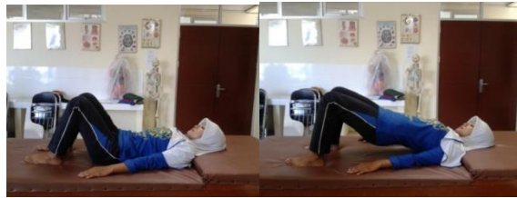
Gambar 3.13 Briging exercise

kedua kaki dan mengangkat pantat ke atas sehingga trunk lurus (bahu, panggul, dan lutut pada satu garis). Ambil napas saat angkat pantat lalu buang napas saat pantat diturunkan. Pertahankan 5-10 detik saat mengangkat dan berpikirlah pantat ditekan ketika pantat diangkat (pengulangan 10 kali).