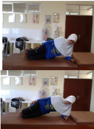
Gambar 3.17 Side Bridge Exercise

Latihan dapat dilakukan pada posisi awal tidur miring, berat badan didistribusikan merata dengan posisi trunk lurus. Perlahan angkat badan lurus (pinggul dan lutut ditinggikan/diangkat) dengan tumpuan pada siku (elbow fleksi) dan kaki. Pertahankan keseimbangan tubuh. Pertahankan 5-10 detik saat mengangkat (pengulangan 10 kali).