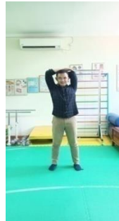
Gambar 3.8 Stretching lengan tangan