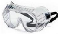
Gambar 3.24 Alat Pelindung Mata